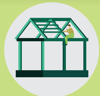
PUNA NË LARTËSI