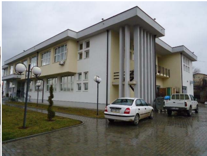
Objekti i QAP në Ferizaj

Gjithashtu një objekt i ngjashëm është në ndërtim e sipër edhe në Mitrovicë.