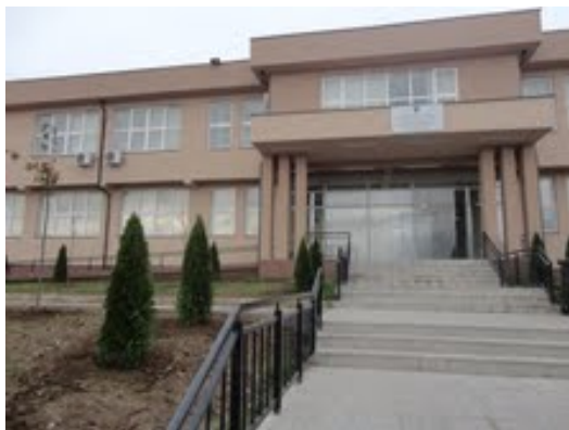
Objekti i QAP në Gjilan

Me qëllim të gjetjes sa më të lehtë të vendeve të punës, MPMS-ja përmes shtatë qendrave rajonale të aftësimit profesional ka organizuar trajnime falas në rreth 35 profesione për punëkërkesit e regjistruar në shërbimet publike të punësimit. Për t'u ofruar kushte sa më të mira pune stafit dhe punëkërkesve që trajnohen, gjatë vitit 2012 janë ndërtuar dhe funksionalizuar dy objekte moderne për aftësim profesional, në Ferizaj dhe Gjilan.